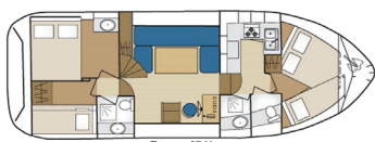
Tarpon 37 N