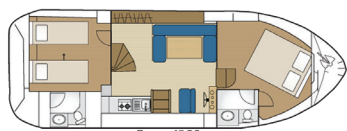
Tarpon 37 DP